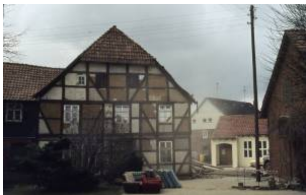
Vor der Nutzung das „Alten Schulhauses“ fand der Unterricht von 1809 - 1886 im Lehrerhaus statt. Aufnahme von 1981