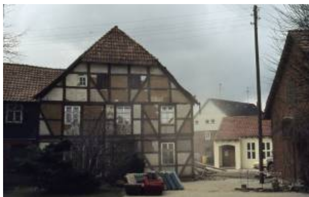
Vor der Nutzung das „Alten Schulhauses“ fand der Unterricht von 1809 - 1886 im Lehrerhaus statt. Aufnahme von 1981