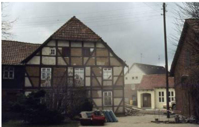
Vor der Nutzung das „Alten Schulhauses“ fand der Unterricht von 1809 - 1886 im Lehrerhaus statt. Aufnahme von 1981