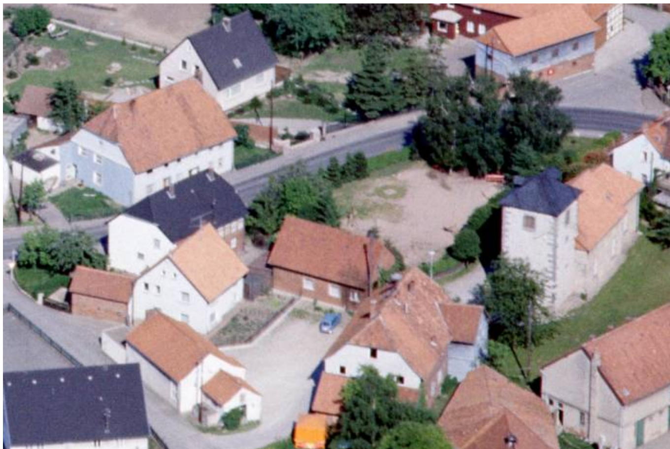
Altes Luftbild des Kirchplatzes mit Lehrerhaus im Vordergrund

Vor der Nutzung das „Alten Schulhauses“ fand der Unterricht von 1809 - 1886 im Lehrerhaus statt. Aufnahme von 1981 zu Beginn der Abrisses