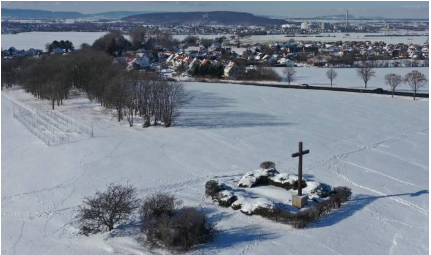
Aufnahme: Patrik Grieger, Februar 2021

From: https://www.jerolewitz.de/dokuwiki/heywiki/ - HeyWiki